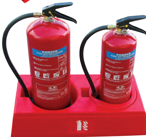
JFP2 & JFPINSERT