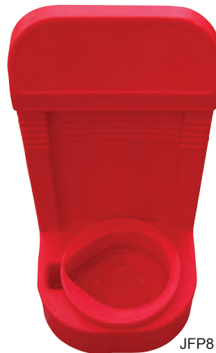
JFP8 & JFPINSERT