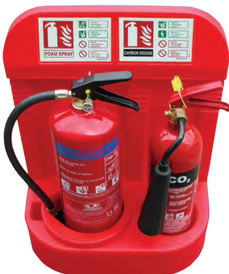
JFP7 & JFPINSERT